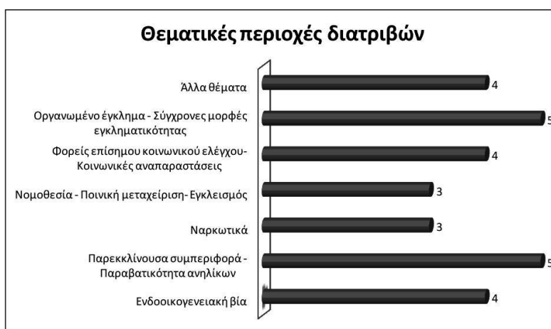
Διάγραμμα 2: Θεματικά πεδία διδακτορικών διατριβών Τομέα Εγκληματολογίας, 1994-2009.

Όπως φαίνεται στο διάγραμμα 1 , 28 διατριβές έχουν υποστηριχθεί το διάστημα 1994-2009, ενώ οι εγγεγραμμένοι υποψήφιοι διδάκτορες είναι πάνω από 100 22 . Τα θέματα των διατριβών που έχουν ήδη υποστηριχθεί αλλά και εκείνων που εκκρεμούν καλύπτουν τόσο τις όψεις της σύγχρονης εγκληματικότητας όσο και ζητήματα σχετικά με την ποινική νομοθεσία και την αντεγκληματική πολιτική. Σύμφωνα με το διάγραμμα 2 , τα θέματα της παραβατικότητας ανηλίκων και των σύγχρονων μορφών εγκληματικότητας αποτελούν, συχνά, αντικείμενο διδακτορικής διατριβής. Ακολουθούν τα θέματα της ενδοοικογενειακής βίας και της λειτουργίας των φορέων άσκησης του επίσημου κοινωνικού ελέγχου του εγκλήματος, καθώς και θέματα σωφρονιστικής μεταχείρισης, ναρκωτικών κ.ά.